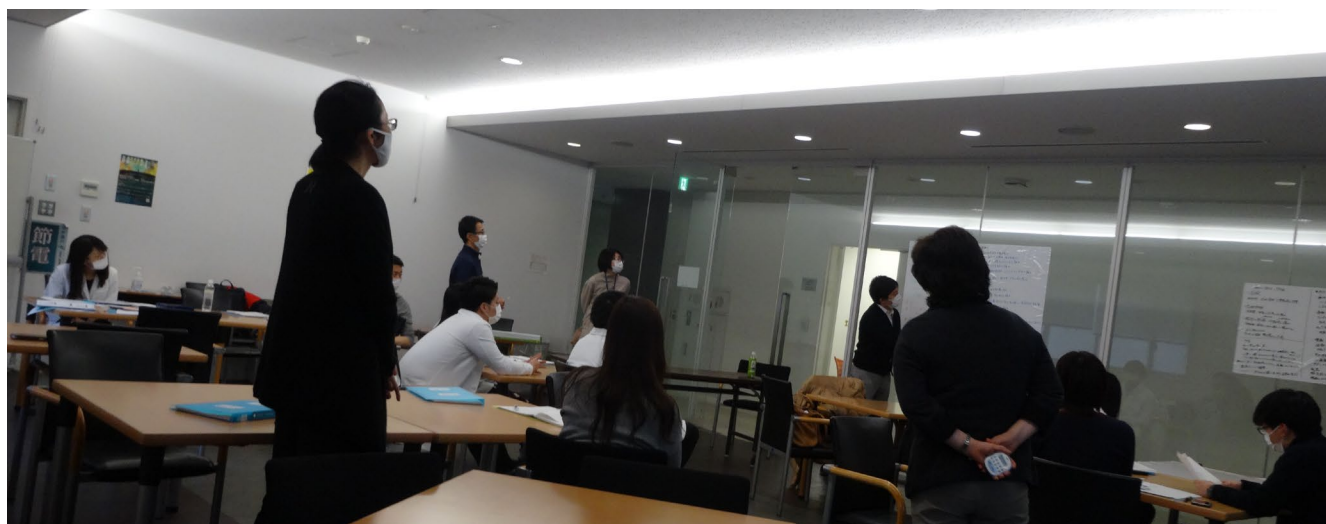
*症例検討もソーシャルディスタンスを保ちながらの発表。